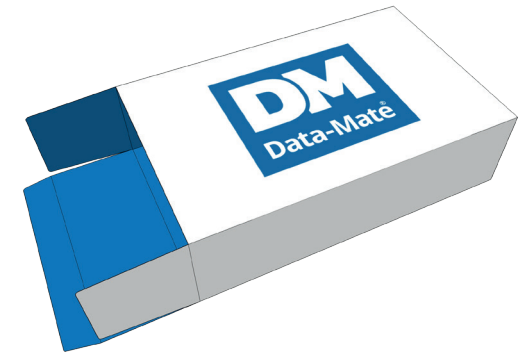
3 Kotelo liimatulla sivusaumalla