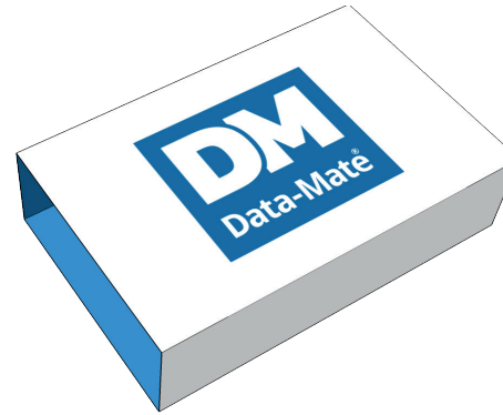
2 Sleeve / holkki