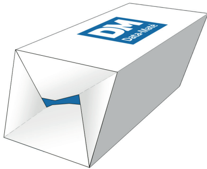
1 Pikapohja / lukkopohja